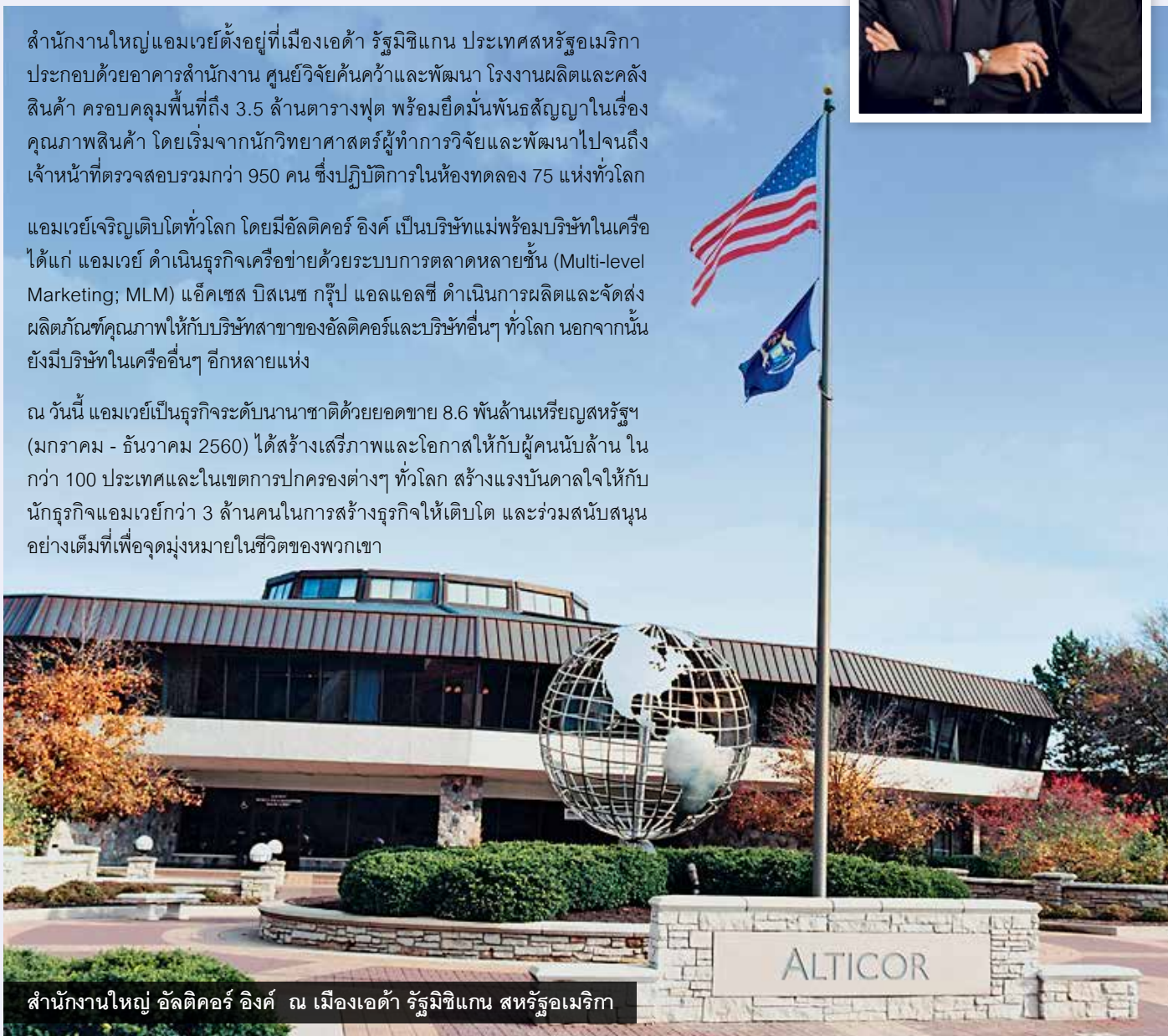
สำนักงานใหญ่ อัลติคอร์ อิงค์ ณ เมืองเอด้า รัฐมิชิแกน สหรัฐอเมริกา

ณ วันนี้ แอมเวย์เป็นธุรกิจระดับโลกที่มีขนาดมหึมาด้วยยอดขาย 8.6 พันล้านเหรียญสหรัฐฯ (มกราคม - ธันวาคม 2560) ได้สร้างเสรีภาพและโอกาสให้กับผู้คนนับล้าน ในกว่า 100 ประเทศและในเขตการปกครองต่างๆ ทั่วโลก สร้างแรงบันดาลใจให้กับนักธุรกิจแอมเวย์กว่า 3 ล้านคนในการสร้างธุรกิจให้เติบโต และร่วมสนับสนุนอย่างเต็มที่เพื่อจุดมุ่งหมายในชีวิตของพวกเขา