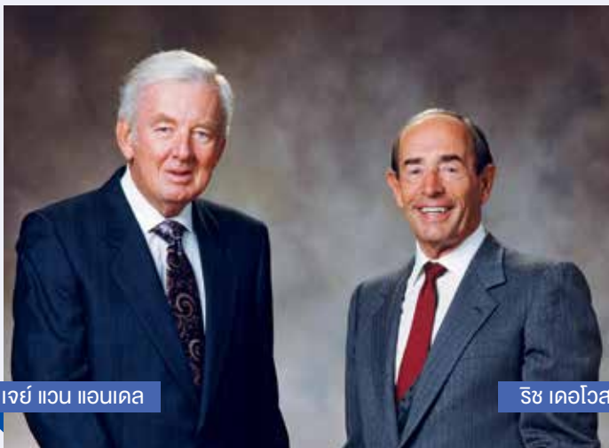
เจย์ แวน แอนเดล

แอมเวย์ก่อตั้งขึ้นในปี 2502 โดยสองผู้สถาปนาคือ ริช เดอไวส และ เจย์ แวน แอนเดล ในระยะแรกนั้นมีผลิตภัณฑ์เพียงชนิดเดียวคือ ผลิตภัณฑ์ทำความสะอาดอเนกประสงค์ แอล.ไอ.ซี. ซึ่งเป็นผลิตภัณฑ์ที่ย่อยสลายได้ทางชีวภาพและเป็นมิตรต่อสิ่งแวดล้อม อันเป็นปณิธานหลักในด้านผลิตภัณฑ์ของแอมเวย์จวบจนปัจจุบัน